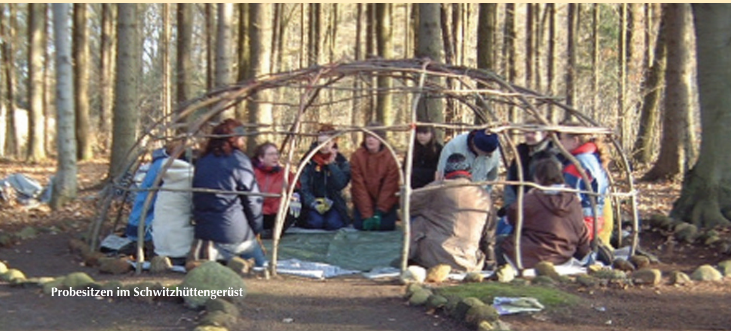
Probesitzen im Schwitzhüttengerüst